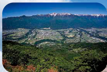
伊那谷と中央アルプス