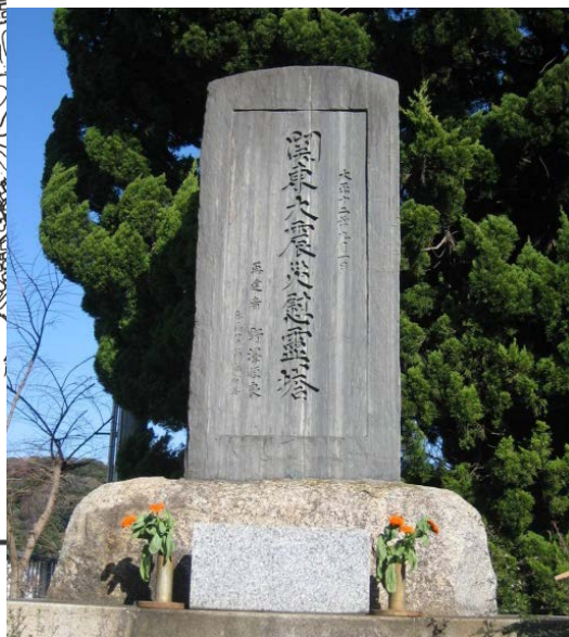
写真2 西浦賀の関東大震災慰霊塔