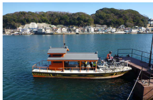
写真1 東浦賀と西浦賀を結ぶ渡船