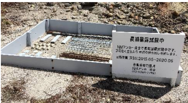
写-1 屋外暴露実施状況 (万座温泉)